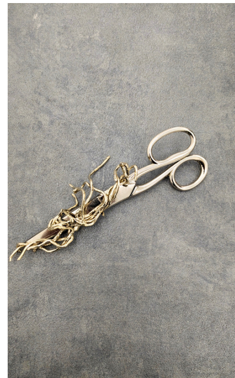
Luca Poncetta Senza titolo, 2024 Forbici, bronzo bianco 4x7x20 cm