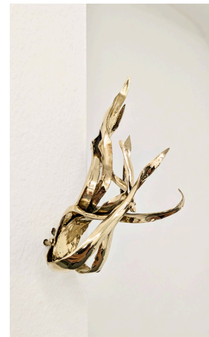
Luca Poncetta Senza titolo 2024 Bronzo bianco 4 elementi, dimensioni variabili