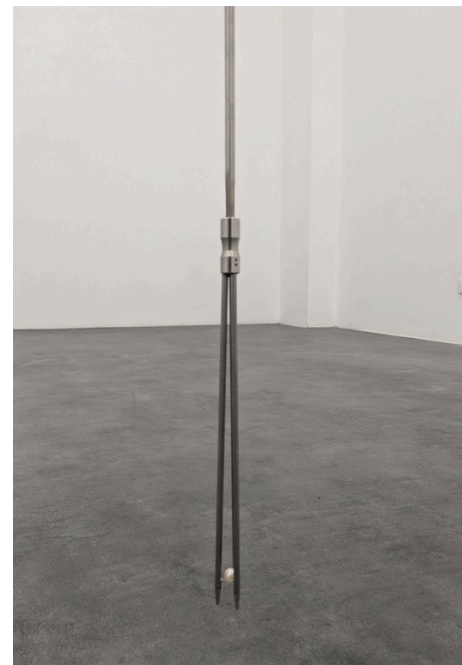
Luca Poncetta Senza titolo 2024 Acciaio, arpione, perla giapponese 165x2x2 cm