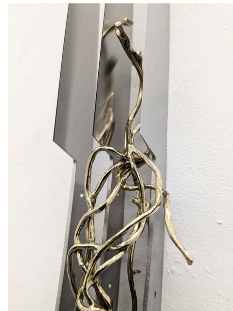
Luca Poncetta, Senza titolo 2024 Lame nude, bronzo bianco 28x6x3,5 cm