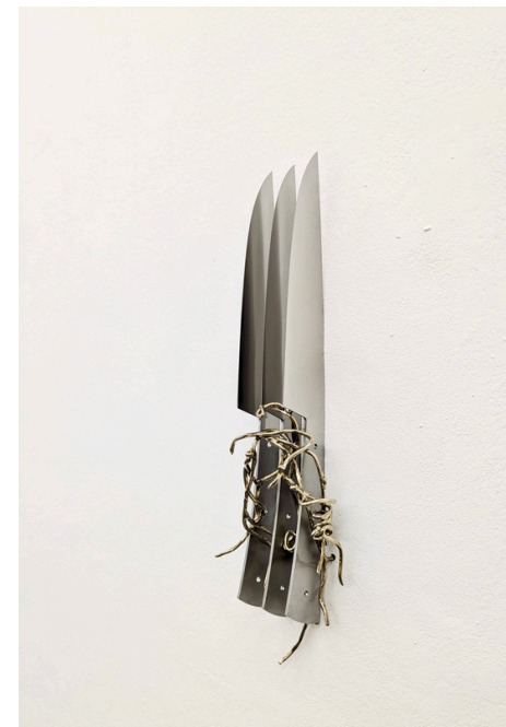
Luca Poncetta Senza titolo 2024 Lame nude, bronzo bianco 30x8x4,5 cm