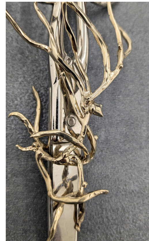
Luca Poncetta Senza titolo 2024 Forbici, bronzo bianco 3x7x19 cm