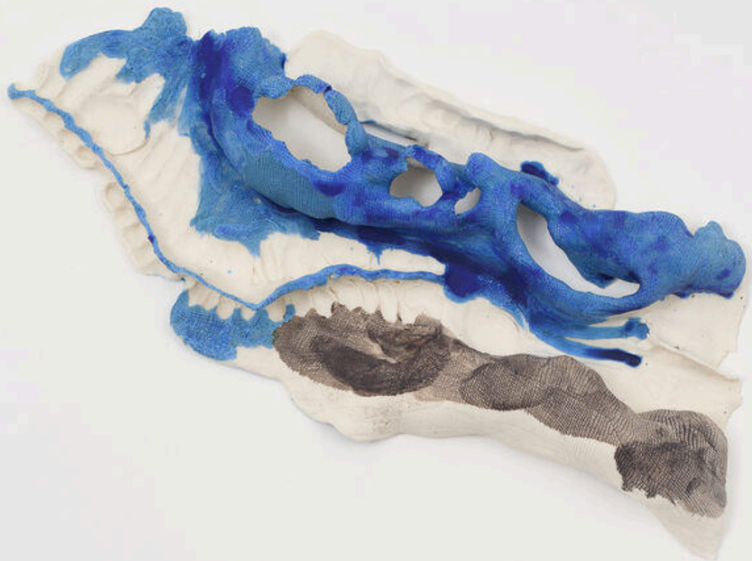
Viola Relle Untitled 2024, porcelain 28x50x6 cm € 2,500 vat. incl.