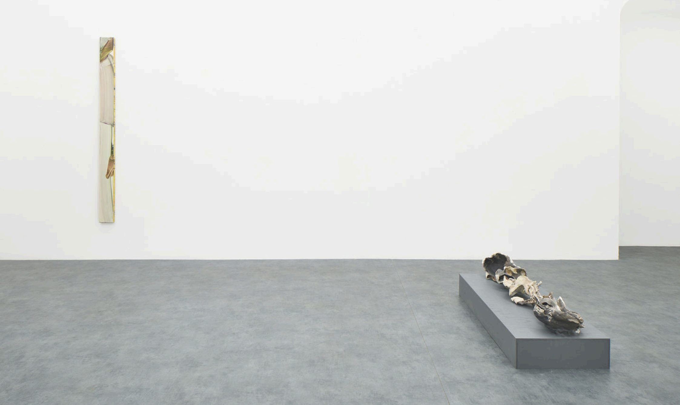
WARM, A+B Gallery, 2024