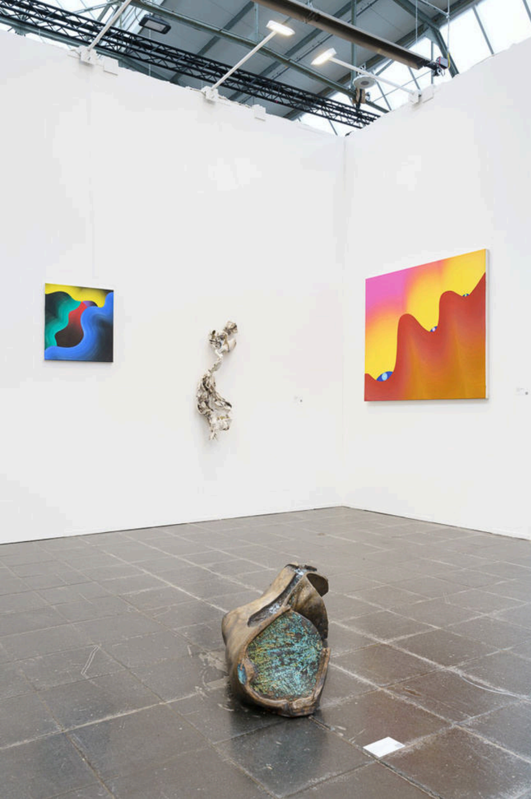
Art Düsseldorf, exhibition view, A+B Gallery stand, Düsseldorf, 2024