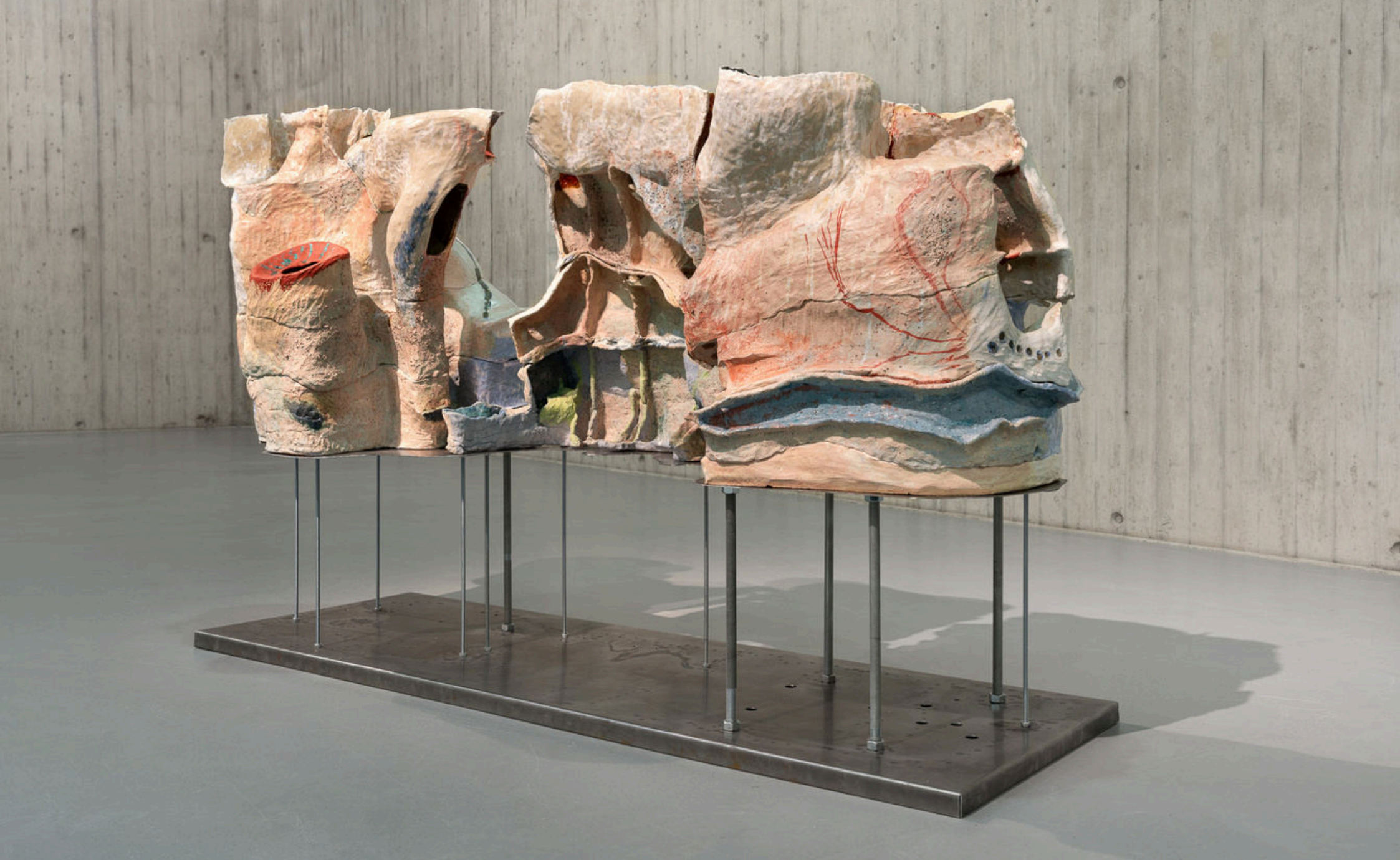
Viola Relle, Gleißende Welt, glazed ceramic, 147x170x70 cm, 2024, € 24,000 vat. incl.