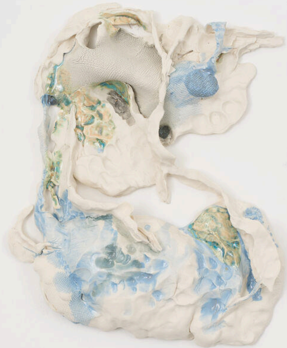
Viola Relle Untitled 2024, porcelain 38x32x6 cm € 2,500 vat. incl.