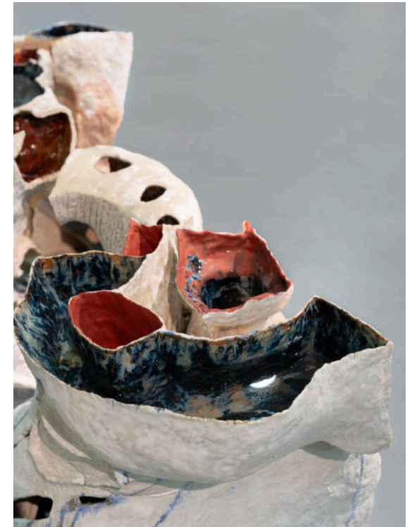
Viola Relle, Gleißende Welt, glazed ceramic, 147×170×70 cm, 2024, € 24,000 vat. incl.