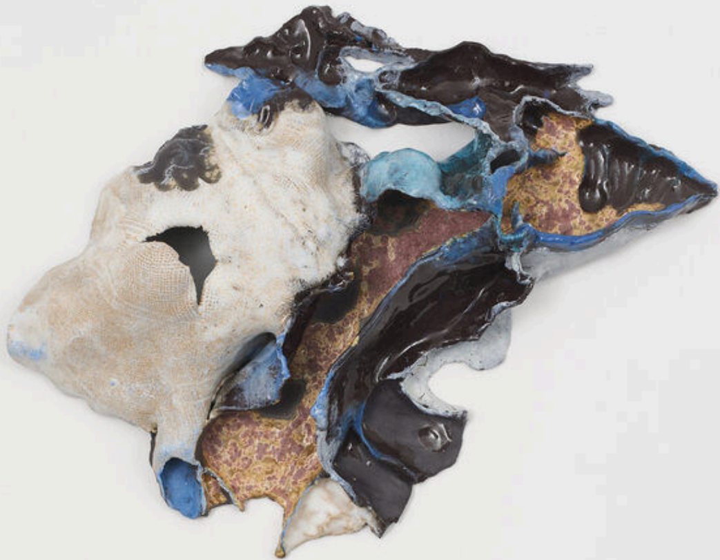
Viola Relle Untitled 2024, porcelain 45x36x4 cm € 2,500 vat. incl.