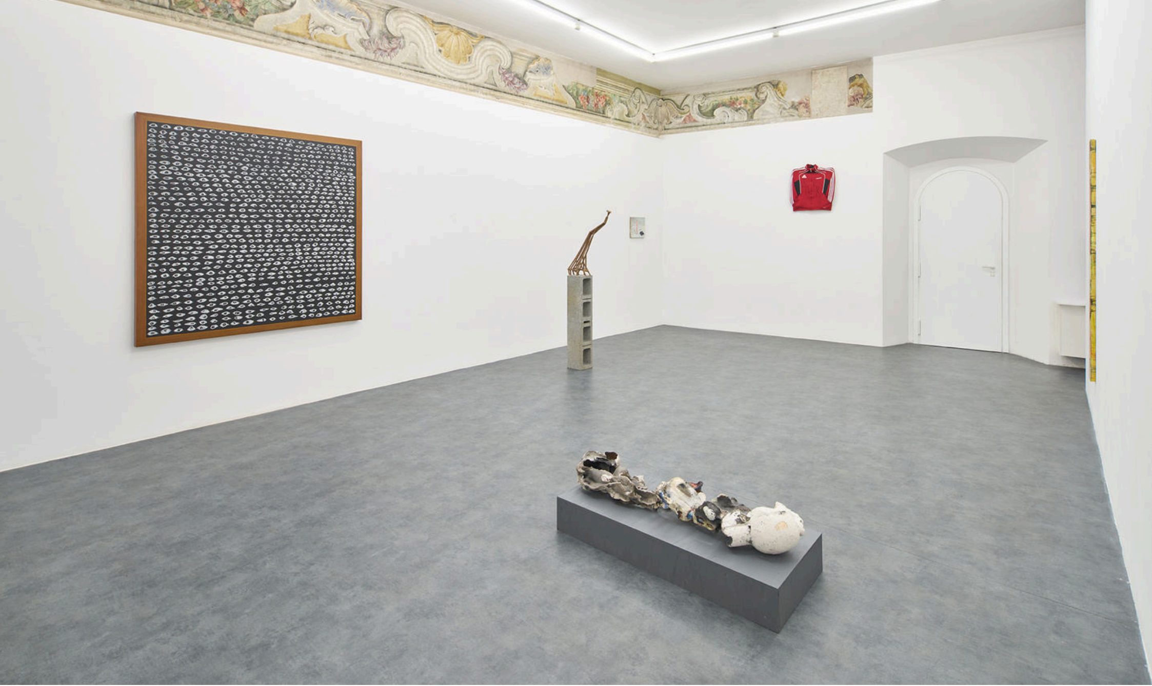
WARM, A+B Gallery, 2024