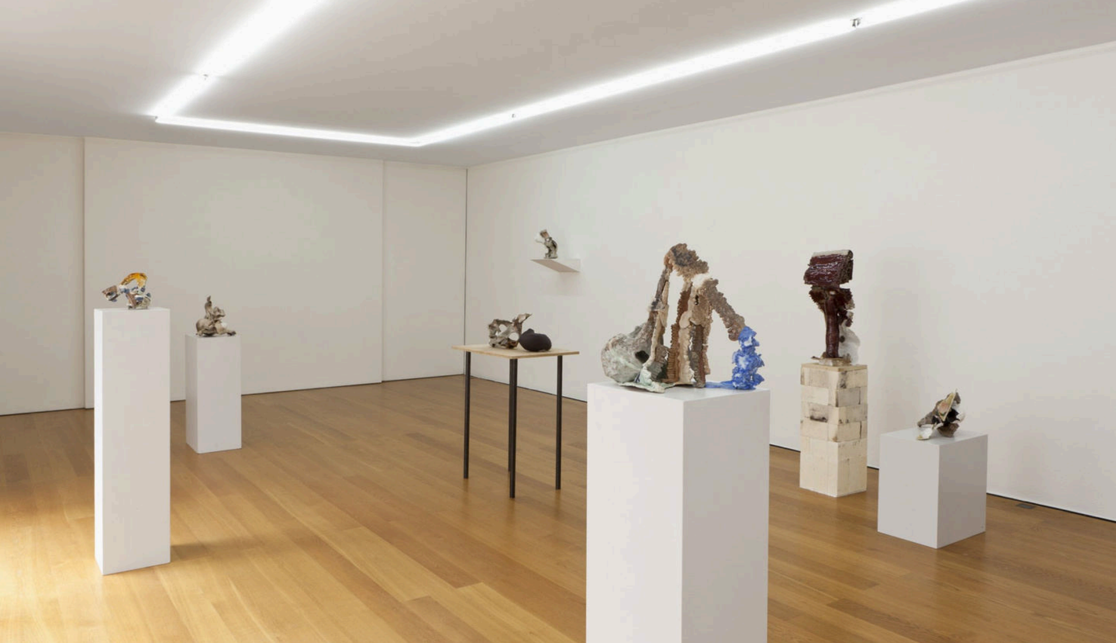
Exhibition view “bring me back to earth”, Rüdiger Schöttle gallery, Monaco, 2019