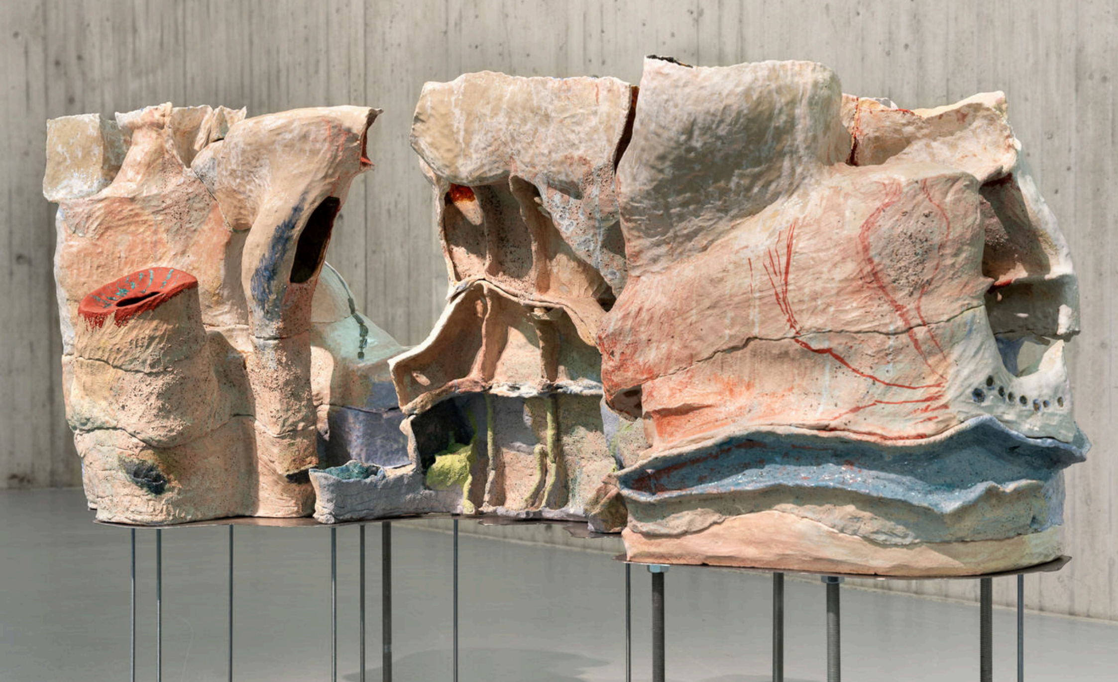
Viola Relle, Gleißende Welt, glazed ceramic, 147×170×70 cm, 2024, € 24,000 vat. incl.