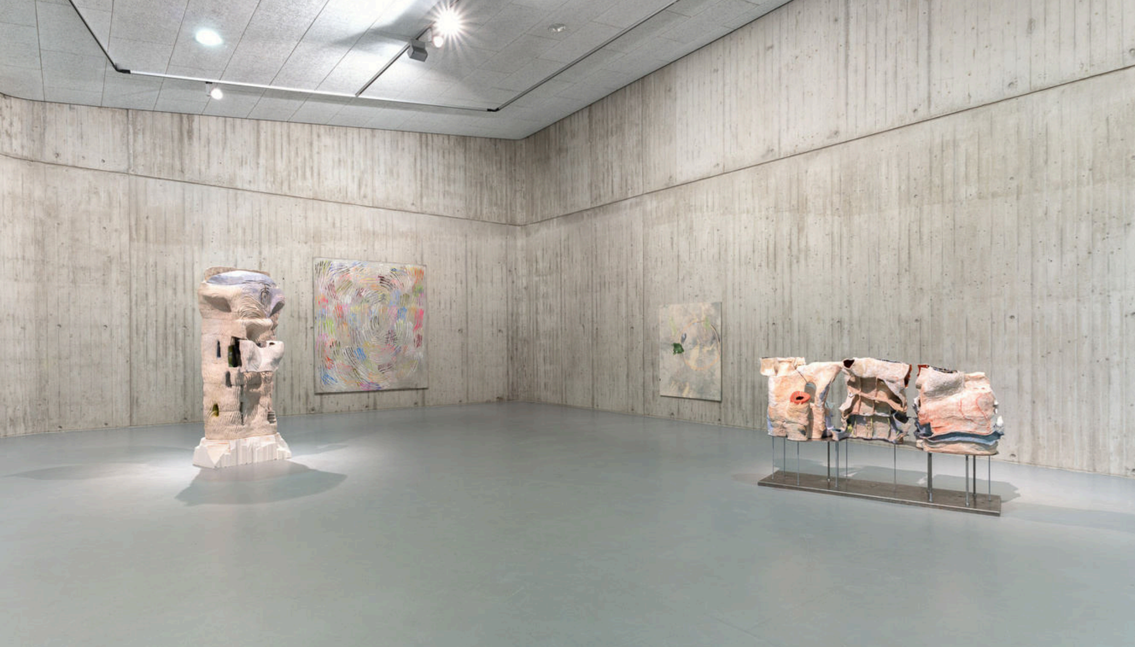
Exhibition view “Flirren ist menschlich”, Neue Galerie Gladbeck, Gladbeck , 2024