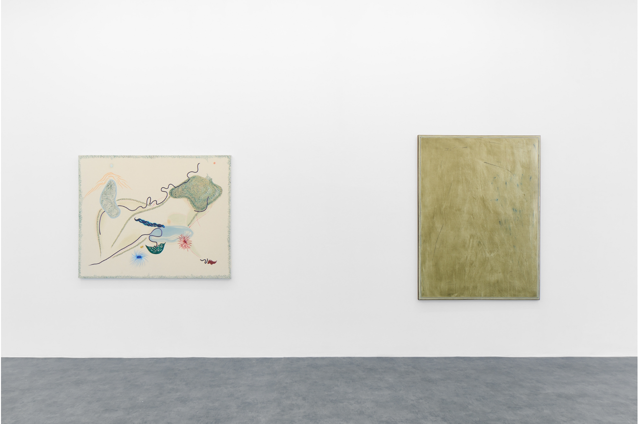
Dog in the window, A+B Gallery, Brescia, 2022