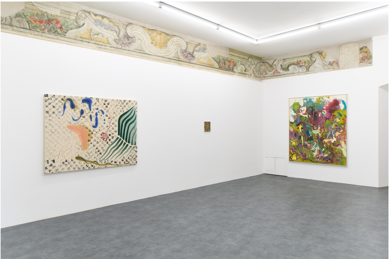
Dog in the window, A+B Gallery, Brescia, 2022