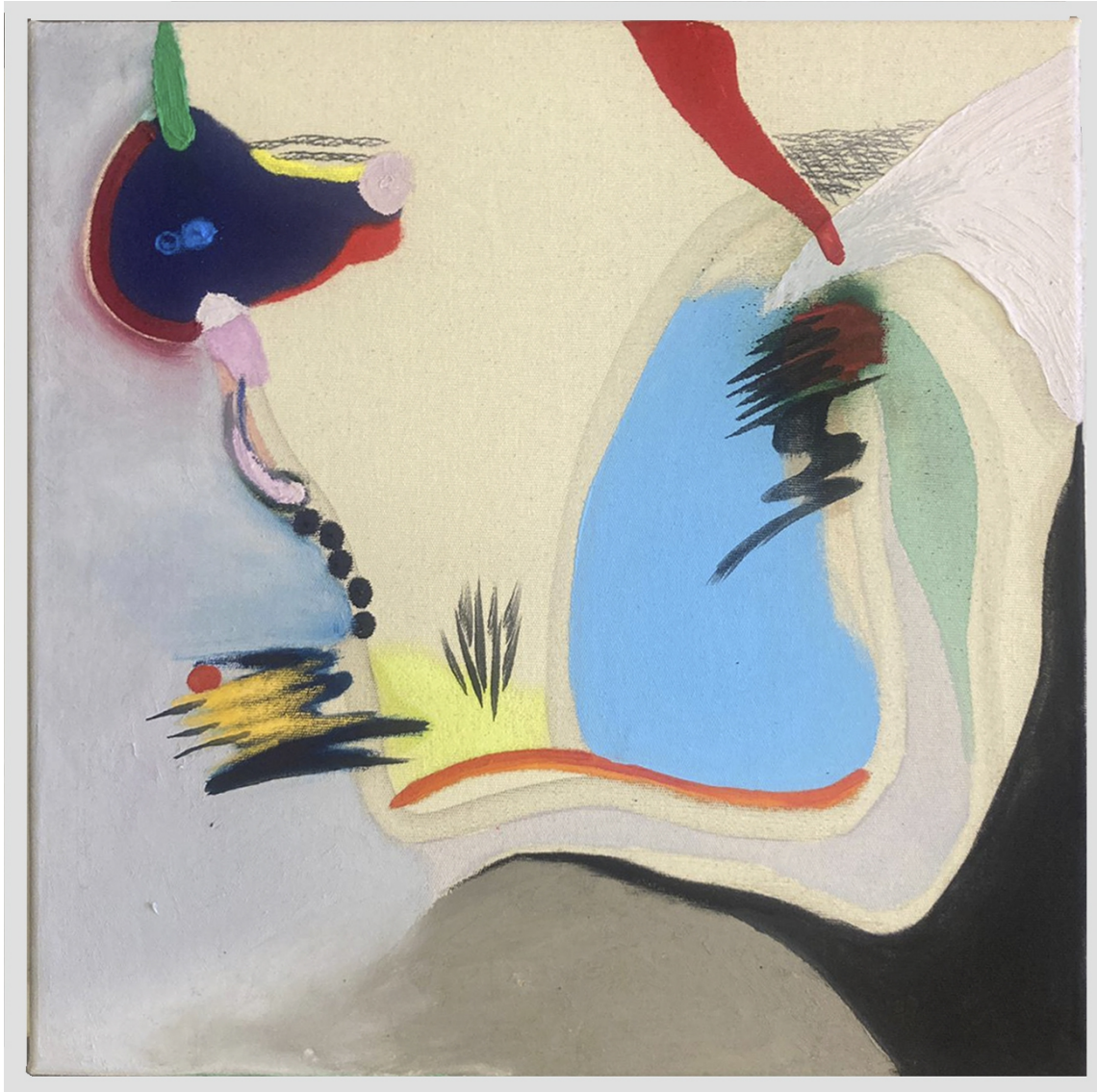
Land grammar, 2022 oil and pastel on unprimed canvas 40 x 40 cm