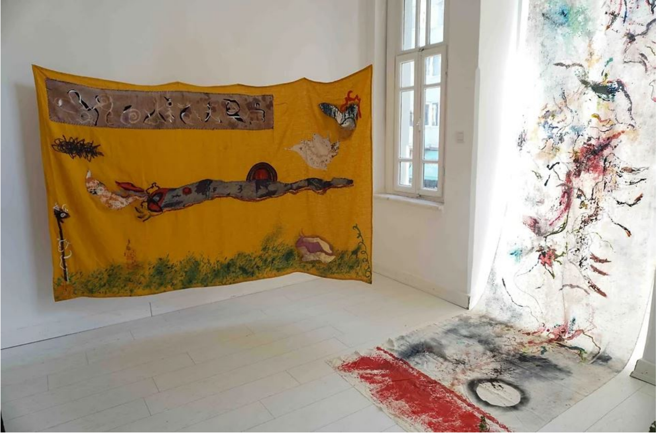
Text, silence, spectacle at Poşe, Istanbul , 2019