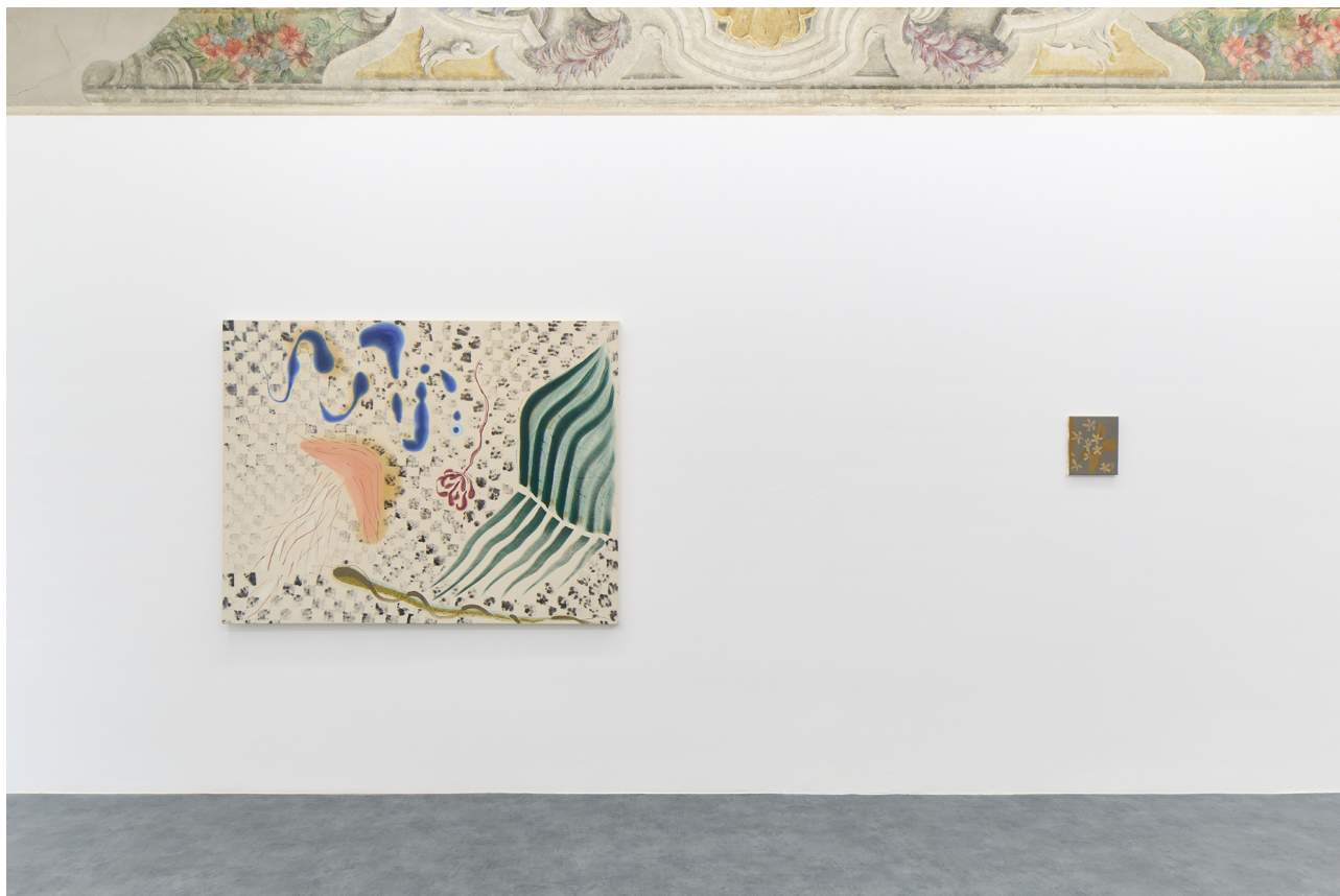
Dog in the window, A+B Gallery, Brescia, 2022