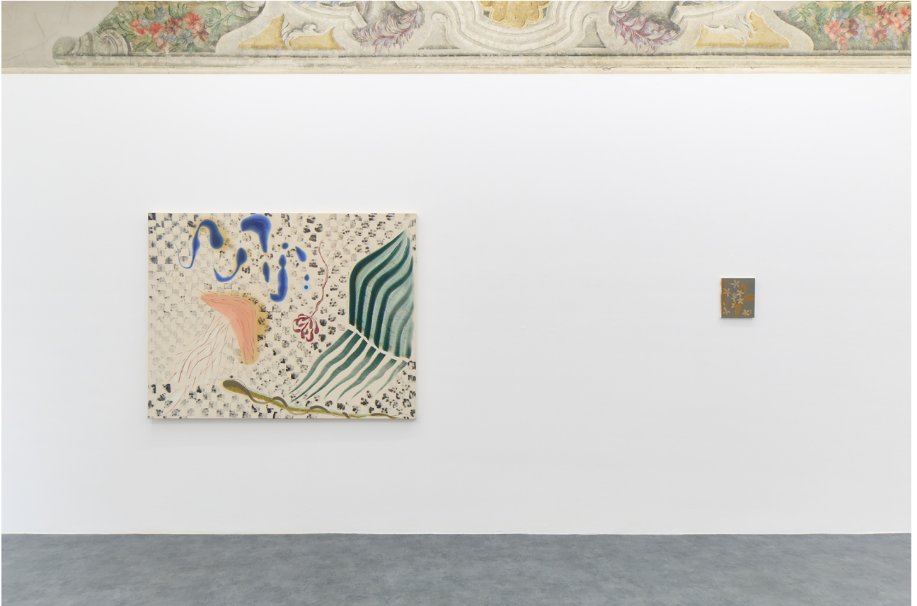
Dog in the window, A+B Gallery, Brescia, 2022