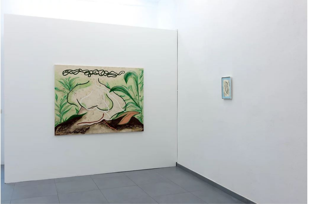
As a chance meeting between a cloud and a rubber stamp on a cusp of land, Ballon Rouge Collective at B.R.Club, Brussels, 2019