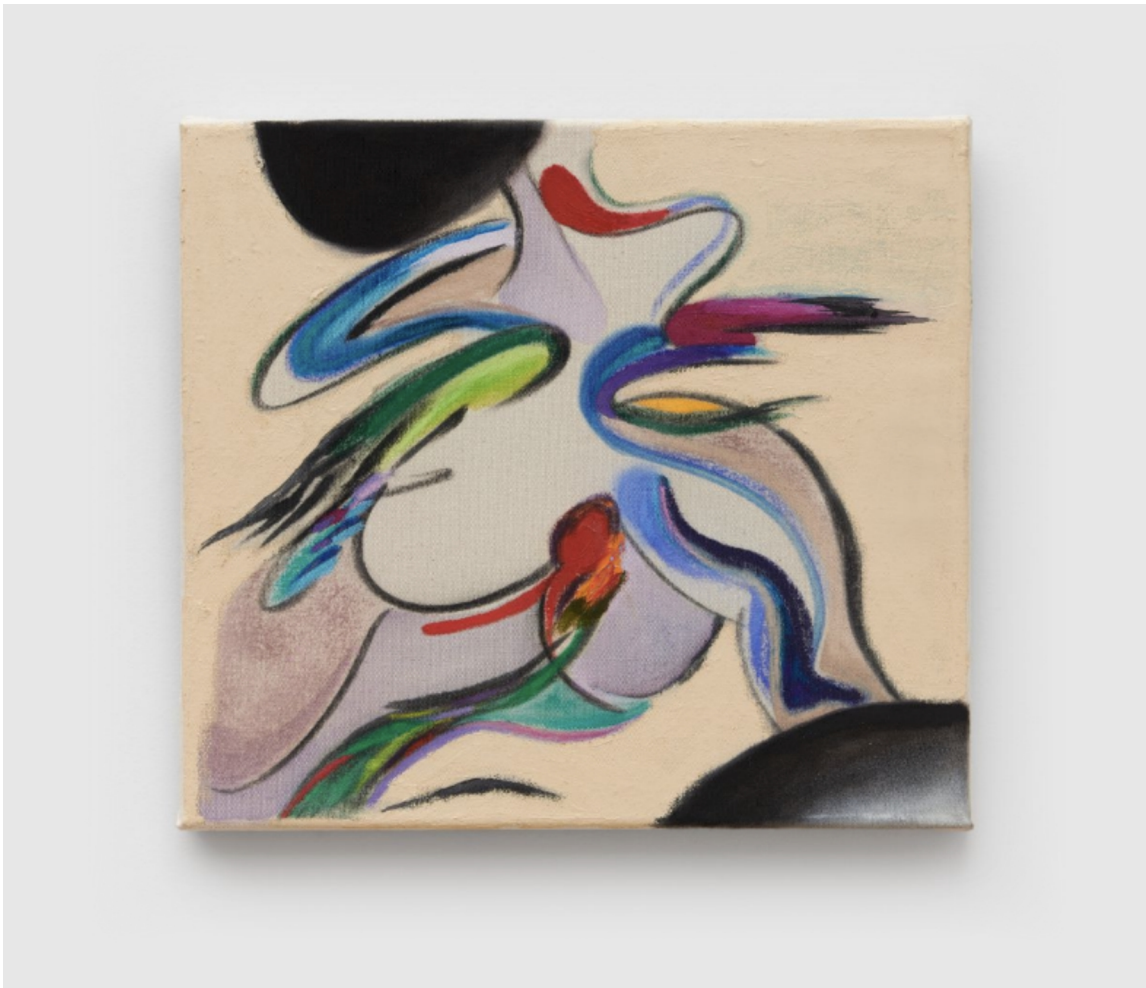
Here and There, 2022 sprau, pastel, charcoal, oil, acrylic on canvas 36 x 39.5 cm